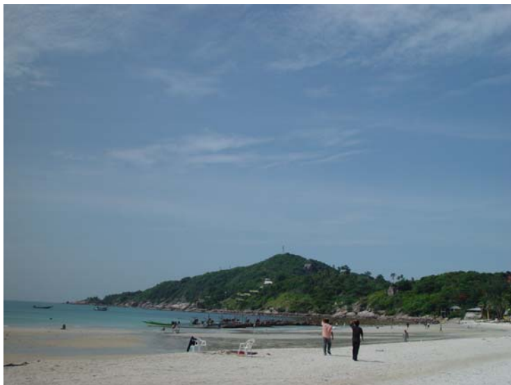
Koh Phangan : Haad Rin Beach (Full Moon Parties)

Supplément requis: dîner du 31 décembre 2011 par adulte : CHF 210.-- / par enfant : CHF 105.--