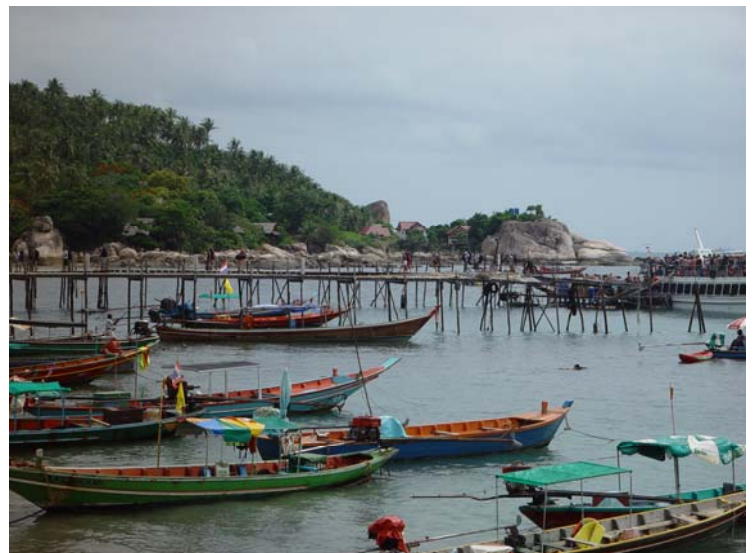
Koh Tao : Arrivée au port