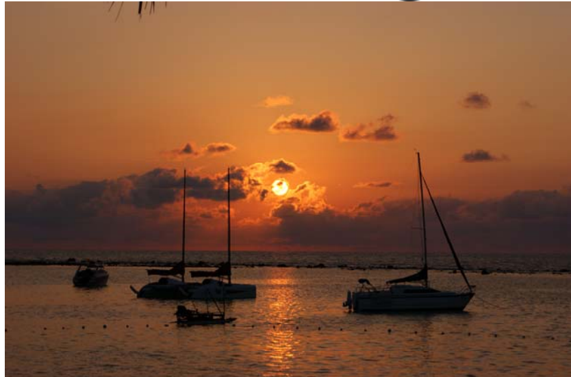
Koh Samui : Chaweng Beach