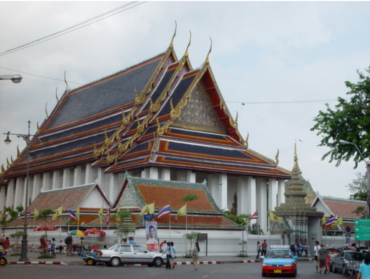
Bangkok : Wat Pho