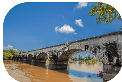
Île de Khone